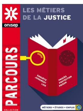
Collection Parcours Octobre 2015, 144 pages http://bit.ly/1OqI7Vn