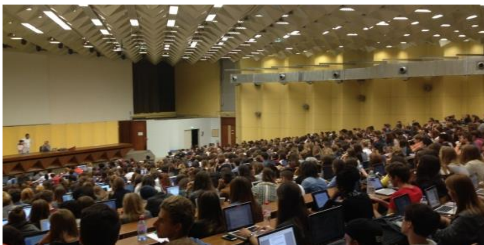
Amphi Aula Magna - Université de Bordeaux - Site de Pessac Amphi dans lequel les étudiants de Licence 1 Droit suivent tous leurs cours magistraux