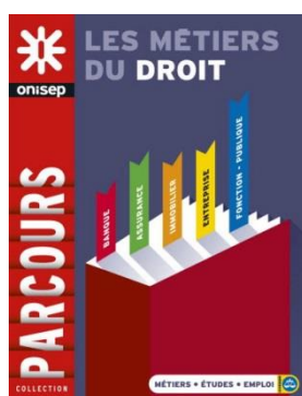
Collection Parcours Octobre 2016, 136 pages http://bit.ly/2drdmTL

➤ En consultation dans les CIO et dans les CDI des lycées